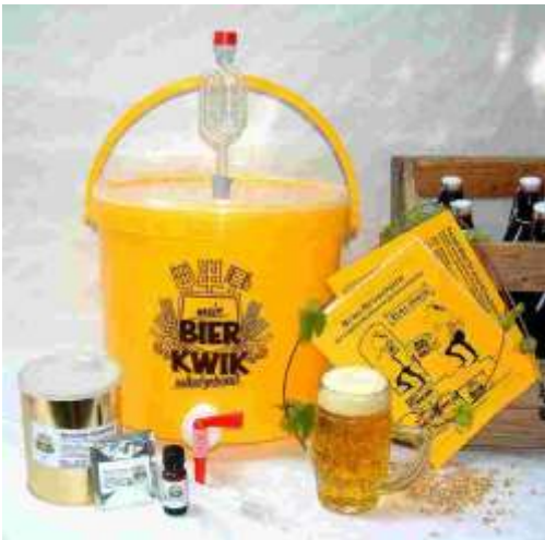
Art. 03-11 Brau-Set Klassiker (mit Deko)