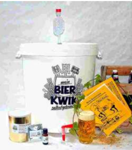
Art. 03-12 Brau-Set Großverbraucher (mit Deko)