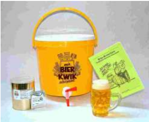
Art. 03-10 Brau-Set Einsteiger (mit Deko)