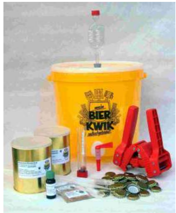
Art. 03-13 Brau-Set Luxus