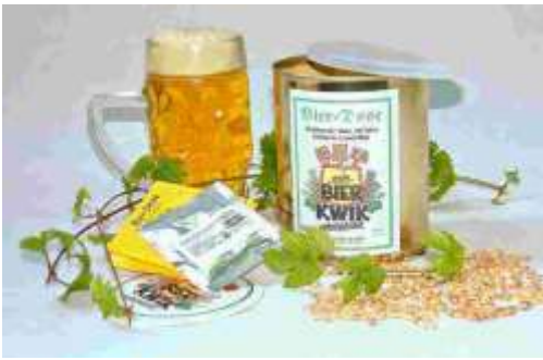
Art. 03-09 Bier-Dose (mit Deko)